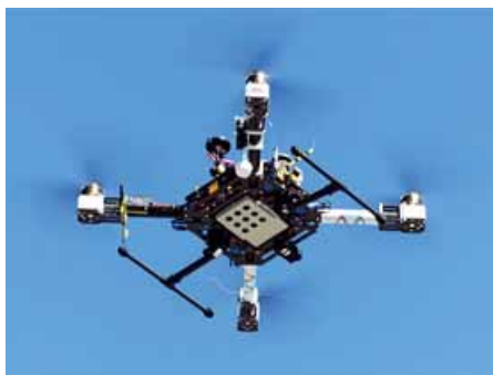
Foto 3 Un drone equipaggiato con sonda multispettrale Maia

Il primo di questi esempi risale infatti a quasi 20 anni fa, sviluppato in Francia per supportare le aziende nella gestione delle concimazioni per i sistemi colturali erbacei (Farmstar, basato su dati satellitari SPOT e oggi attivo su oltre 15.000 aziende per circa 800.000 ha). Grazie anche all'integrazione con dati storici di resa e meteorologici, le mappe satellitari possono essere elaborate attraverso modelli di simulazione agronomica per confrontare diversi possibili scenari conseguenti a differenti pratiche agronomiche. L'ottimizzazione di tali scenari consente non solo di definire le condizioni operative ottimali in termini di tempi di intervento, ma fornisce anche mappe di prescrizione per la dosatura variabile dei diversi input agronomici (semine, concimazioni, irrigazioni, ecc.). L'accesso a questo tipo di informazioni e servizi sta prendendo sempre più piede, con servizi che sono anche resi disponibili gratuitamente: un caso che sta facendo scuola è quello svedese di CropSat, che consente di stimare le variazioni di biomassa in campo e di definire mappe di prescrizione per macchine spandiconcime a rateo variabile. Per quanto concerne la fertilizzazione, questo consente importanti risparmi economici derivanti dalla riduzione o dalla migliore efficacia dei concimi.