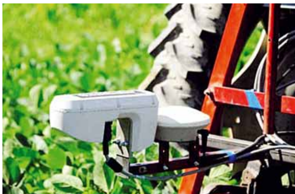
Foto 1 GreenSeeker installato su trattore

Come discusso nell'articolo «Quale futuro per l'impiego dei droni in agricoltura» (pubblicato su L'Informatore Agrario , n. 39/2017 a pag. 54), negli ultimi anni vi è stata una grande spinta verso l'utilizzo di aeromobili per la fornitura di nuovi servizi in agricoltura. Contoterzisti, studi agronomici o aziende agricole