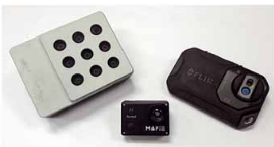
Foto 2 Tre esempi di sensore: multispettrale Maia, con un canale di acquisizione fotografico (RGB) e 8 canali su 89 diverse lunghezze d'onda; al centro la fotocamera Mapir per acquisizioni infrarosse (NIR); a destra un camera Flir che opera sul lontano infrarosso per la stima delle temperature

Le mappe fornite da questi sensori possono essere utilizzate per il monitoraggio dell'evoluzione durante il ciclo colturale (come è stato descritto anche nella parte dedicata ai sensori, pubblicata su L'Informatore Agrario n. 1/2018) e, insieme alle informazioni